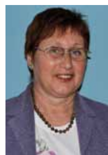
ÖGZMK ZV NÖ