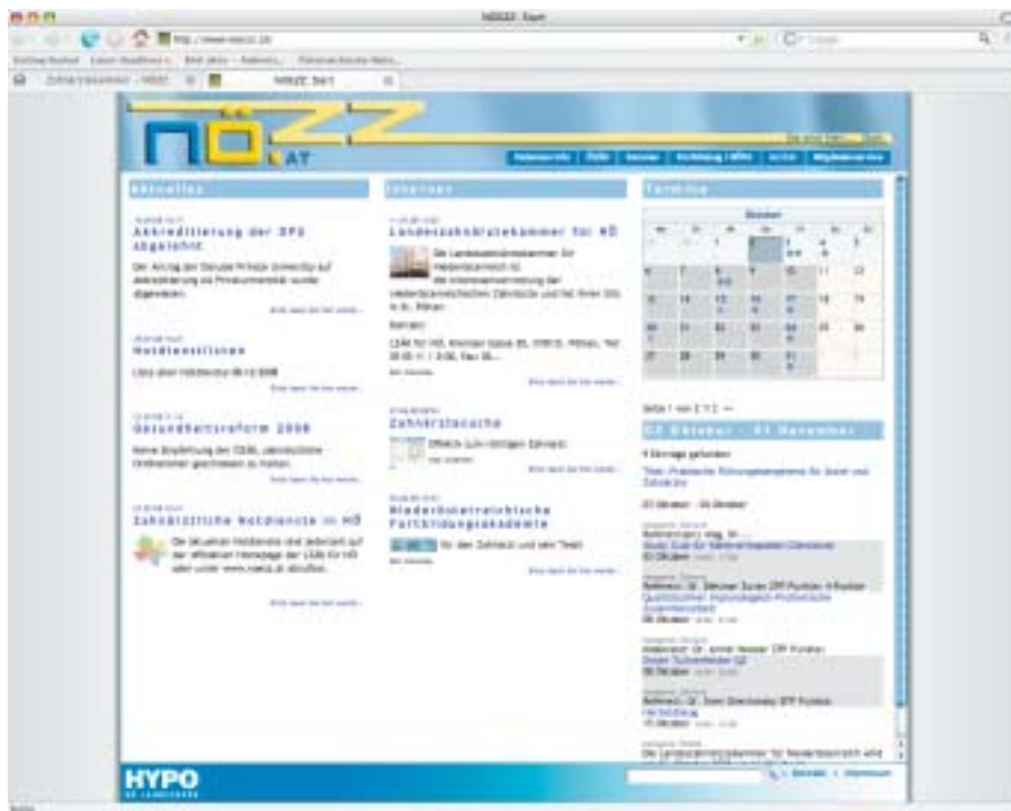
Zur Erinnerung noch einmal das neue Gesicht der LZÄK für NÖ. www.noezz.at

( www.noezz.at ) die Möglichkeit gewisse Vorauswahlen zu treffen (Sie müssen sich mit Ihren Zugangsdaten einloggen!):